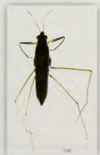
Fig. 11.- Habitus de Gerris ( Gerris ) thoracicus Schum. (♂)

Coloniza los ambientes acuáticos leníticos, de aguas tranquilas, tales como lagunas, estanques, tanquetas de regadío... Además, pueden encontrarse ejemplares de este taxón en las pozas y remansos de los cauces de barrancos.